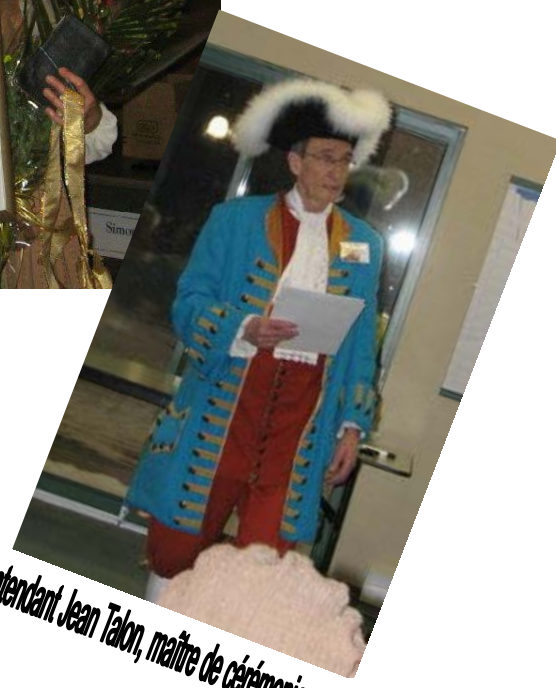
L'intendant Jean Talon, maître de cérémonie